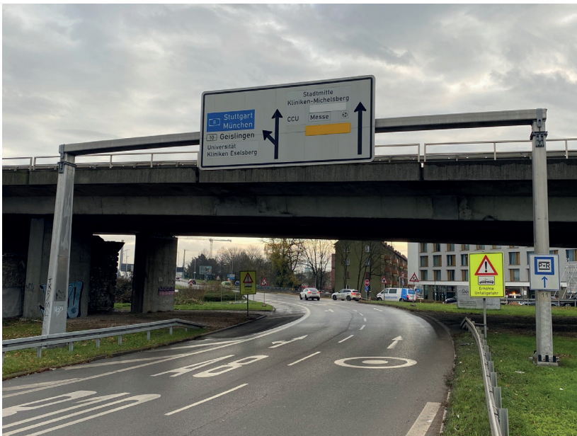
Foto 4: Abbau der Schilderbrücke unter Vollsperrung am 14. Dezember 2024 gegen 01:00 Uhr nachts