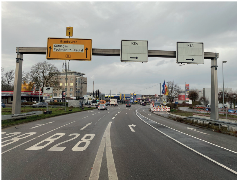
Foto 1: Schilderbrücke am 07. Dezember 2024 gegen 01:00 Uhr nachts

In der Nacht von Freitag, 06. Dezember 2024, auf Samstag, 07. Dezember 2024, werden die Schilderbrücken am Blaubeurer Ring/Abfahrt Blaubeurer Straße (Foto 1) und der Schilderarm von der B10 kommen in Richtung IKEA (Foto 2) abgebaut. Voraussichtlich gegen 01:00 Uhr nachts wird hier kurzzeitig gesperrt sein.