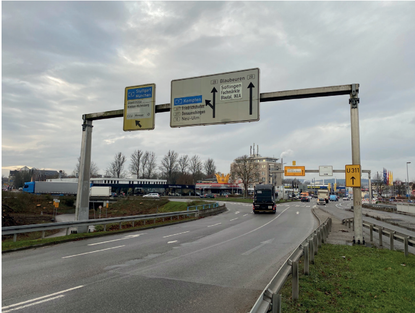
Foto 3: Abbau der Schilderbrücke unter Vollsperrung am 13. Dezember 2024 gegen 22:00 Uhr nachts

In der Nacht von Freitag, 13. Dezember 2024, auf Samstag, 14. Dezember 2024, folgt der Abbau von zwei Schilderbrücken im Blaubeurer Ring. Hier wird voraussichtlich gegen 22:00 Uhr von der Stadtmitte kommend in Richtung Blaubeurer Straße (Foto 3) gesperrt sein. Voraussichtlich gegen 01:00 Uhr wird dann von der Blaubeurer Straße kommend in Richtung Stadtmitte (Foto 4) kurzzeitig gesperrt werden.